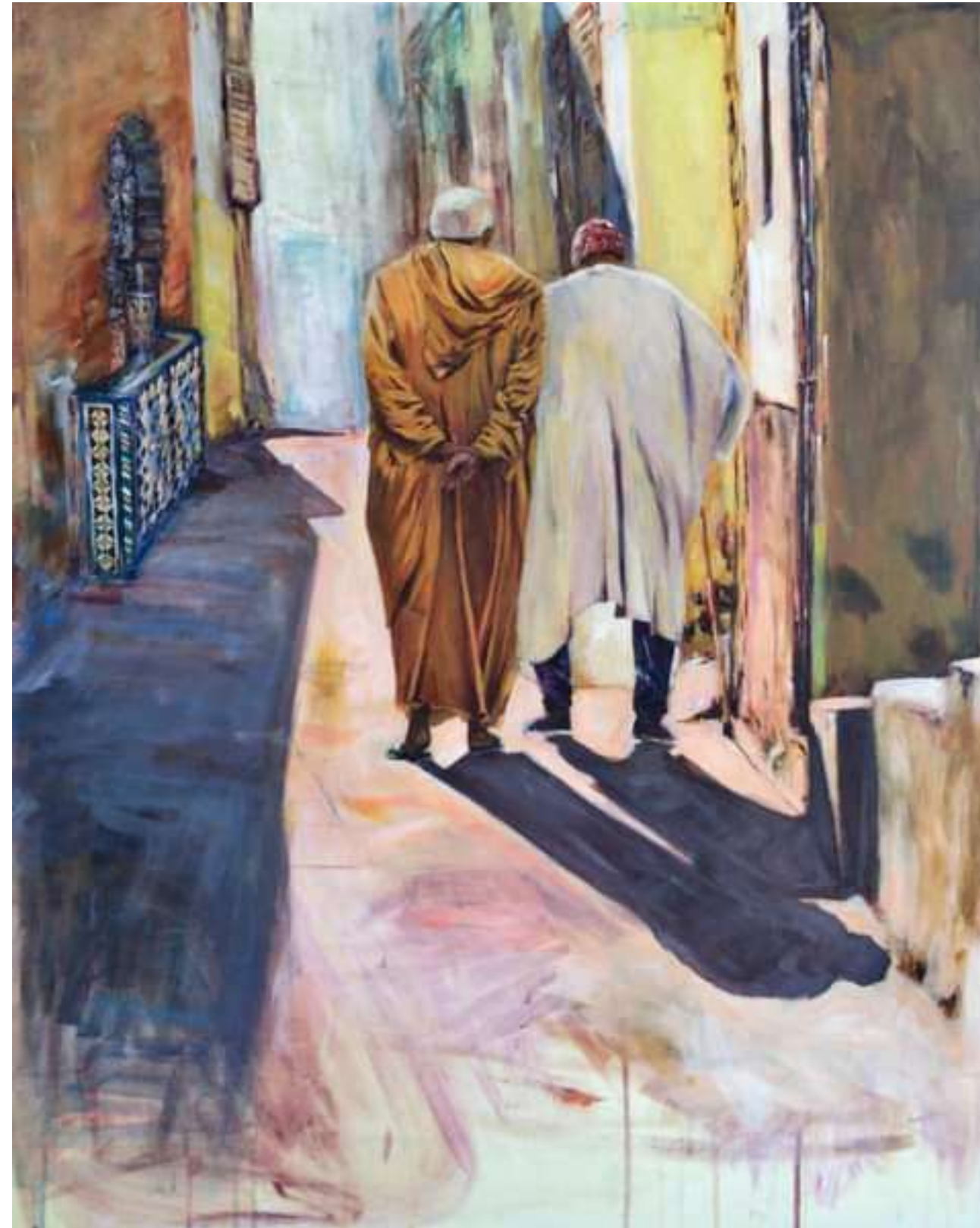
HACIA EL FINAL DEL CAMINO ACRÍLICO SOBRE LIENZO 80 x 100 cm