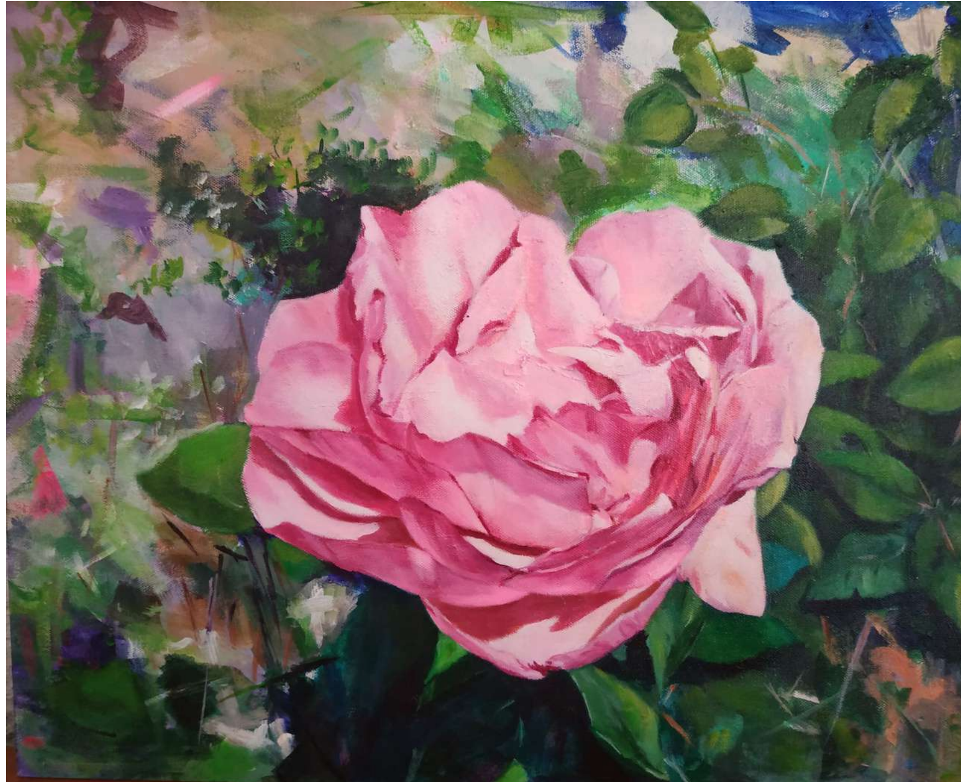
ROSA ROSAE ACRÍLICO SOBRE TABLA 40 x 30 cm