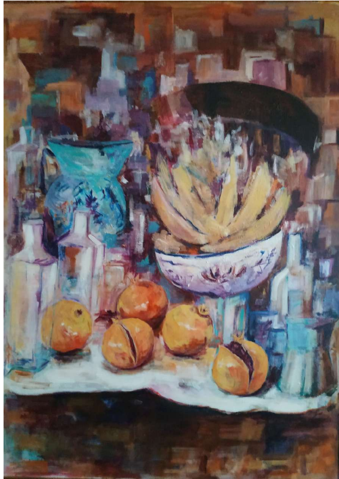
BODEGÓN DE LAS GRANADAS ACRILICO SOBRE LIENZO 70 x 100 cm