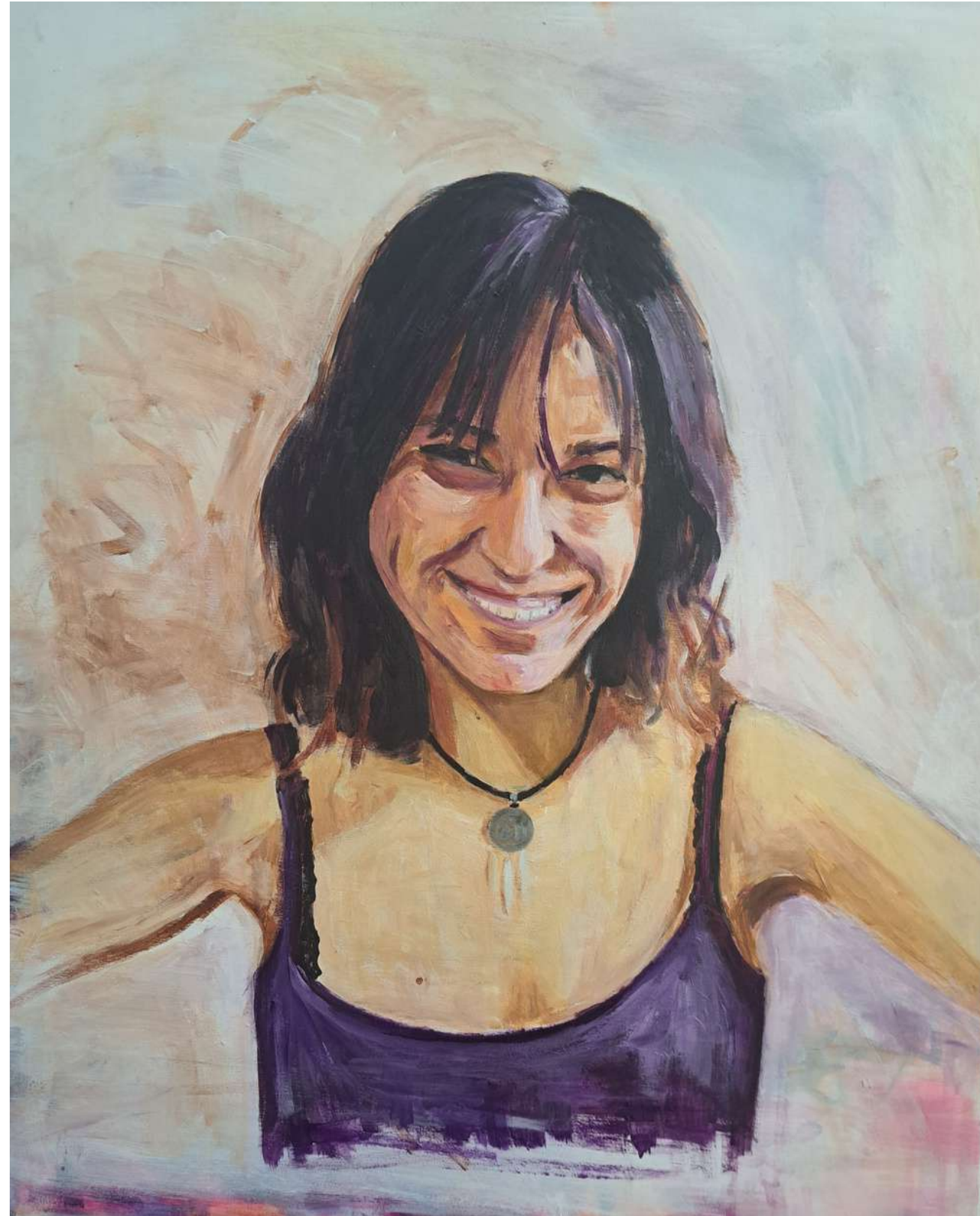
RETRATO II ACRÍLICO SOBRE LIENZO 50 x 60 cm