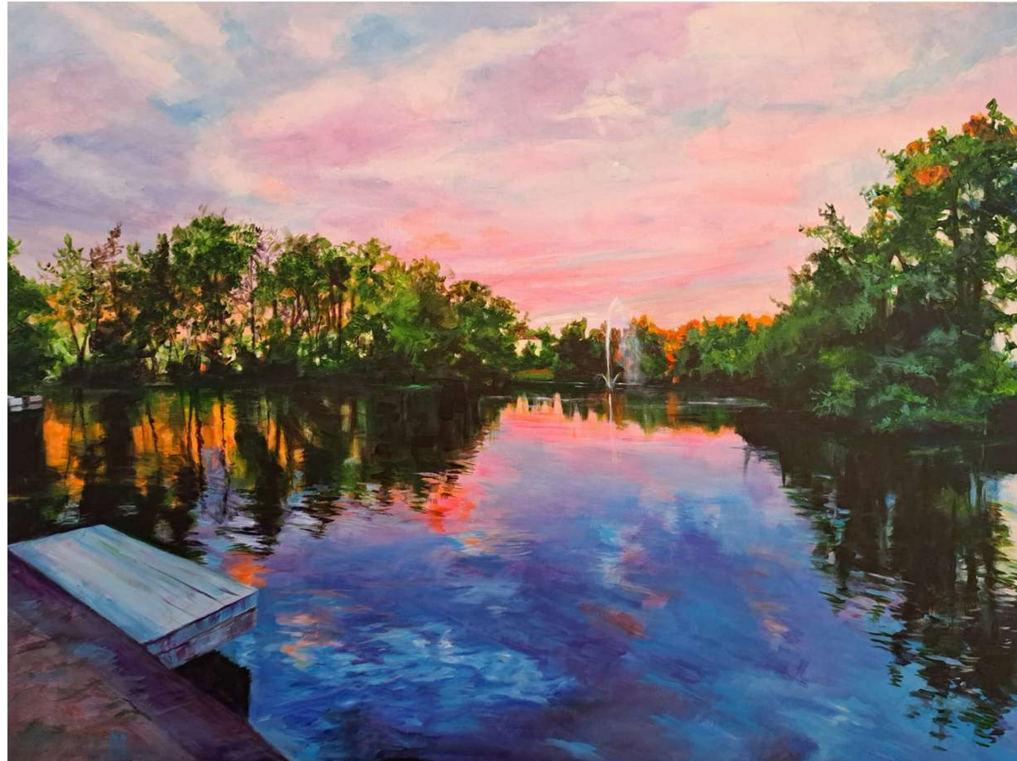
FUENTE EN EL LAGO DE LINKOPING ACRÍLICO SOBRE LIENZO 60 x 80 cm