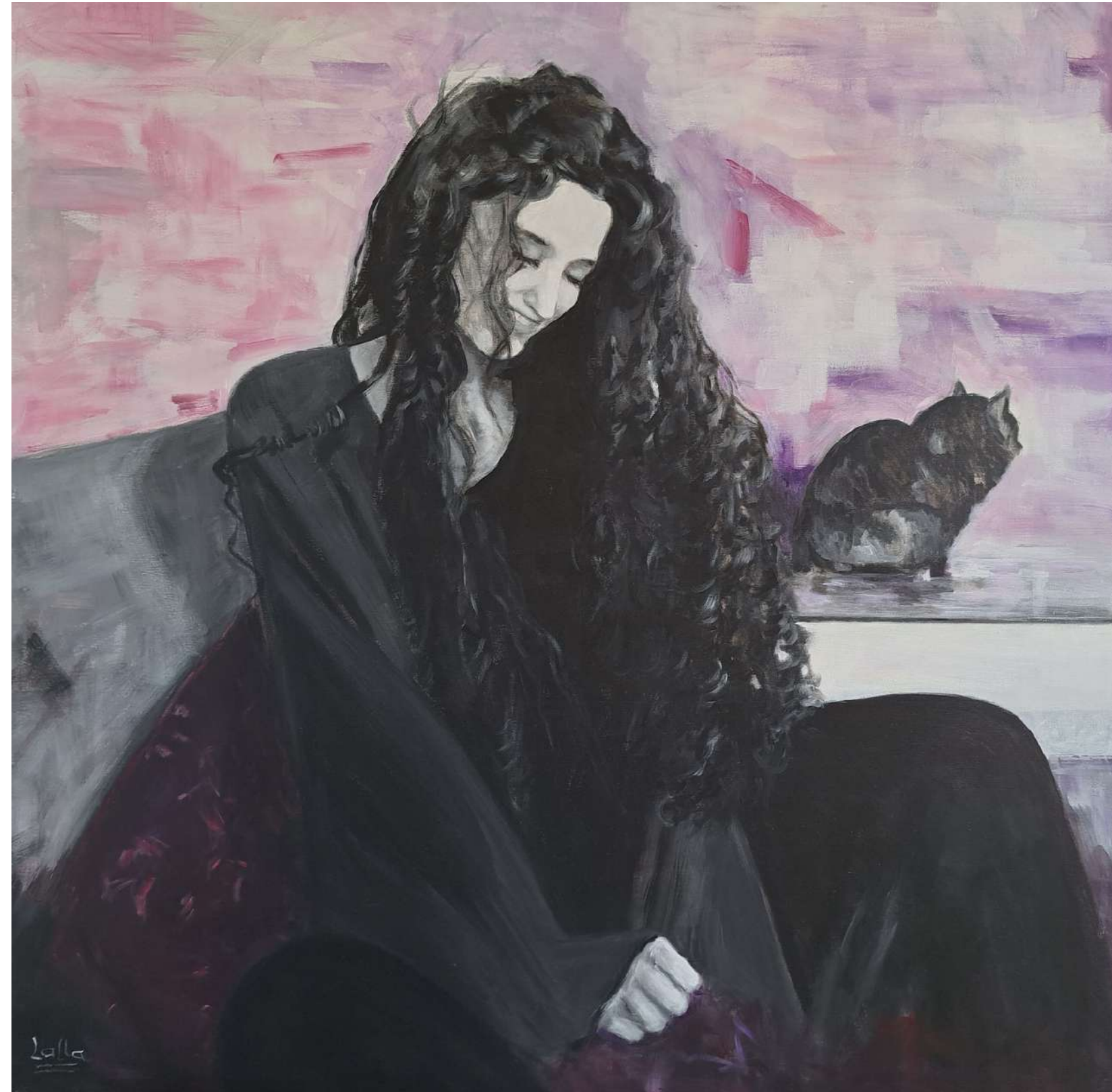
LA SONRISA DE FÁTIMA CARBONCILLO Y ACRÍLICO SOBRE LIENZO 80 x 80 cm