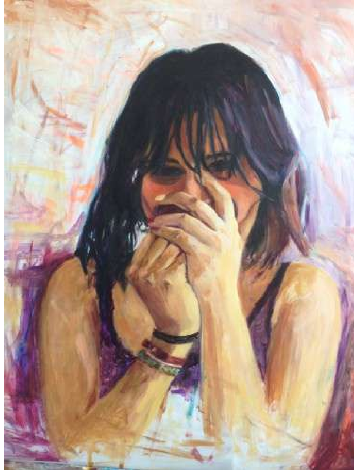
RETRATO I ACRÍLICO SOBRE TABLA 40 x 50 cm