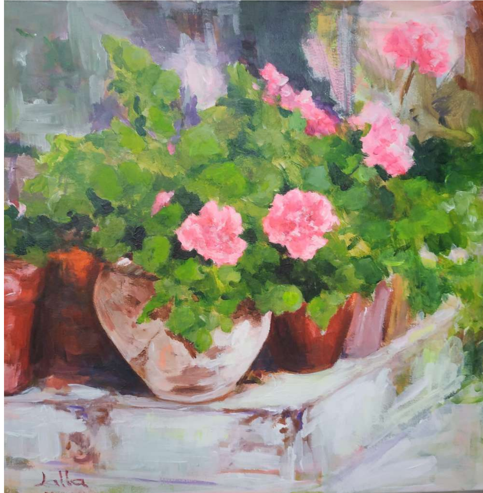
EN EL PATIO ACRILICO SOBRE LIENZO 30 x 30 cm