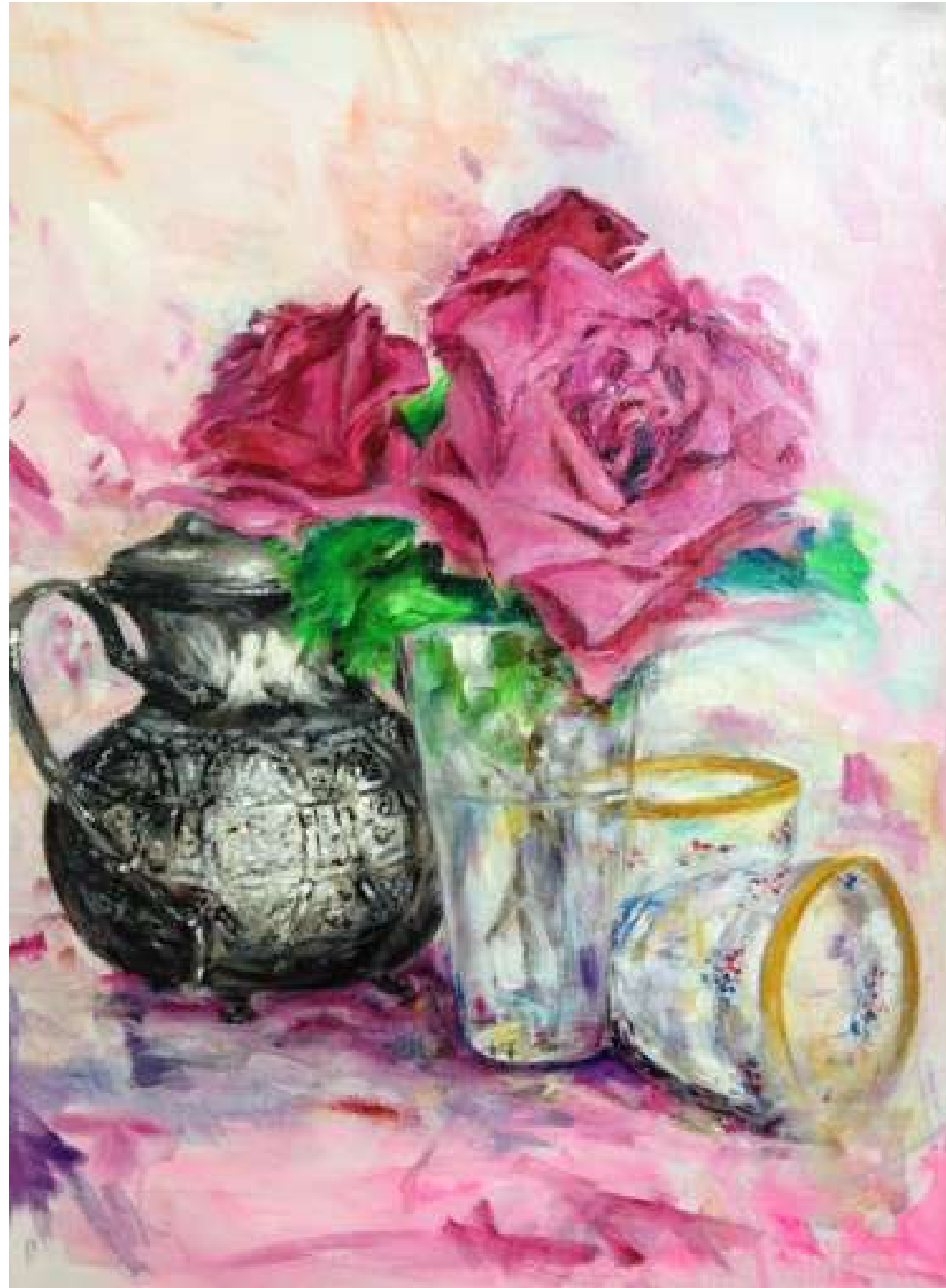
LA TETERA ACRÍLICO SOBRE LIENZO 30 x 40 cm