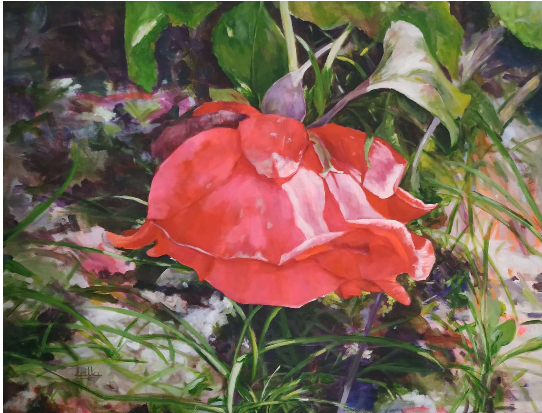
ROSA CAIDA ACRÍLICO SOBRE LIENZO 65 x 50 cm