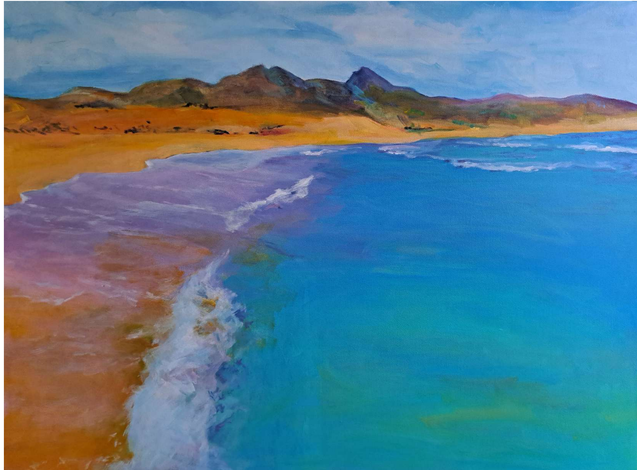
EL MAR MENOR QUE FUE ACRILICO SOBRE LIENZO 60 x 80 cm