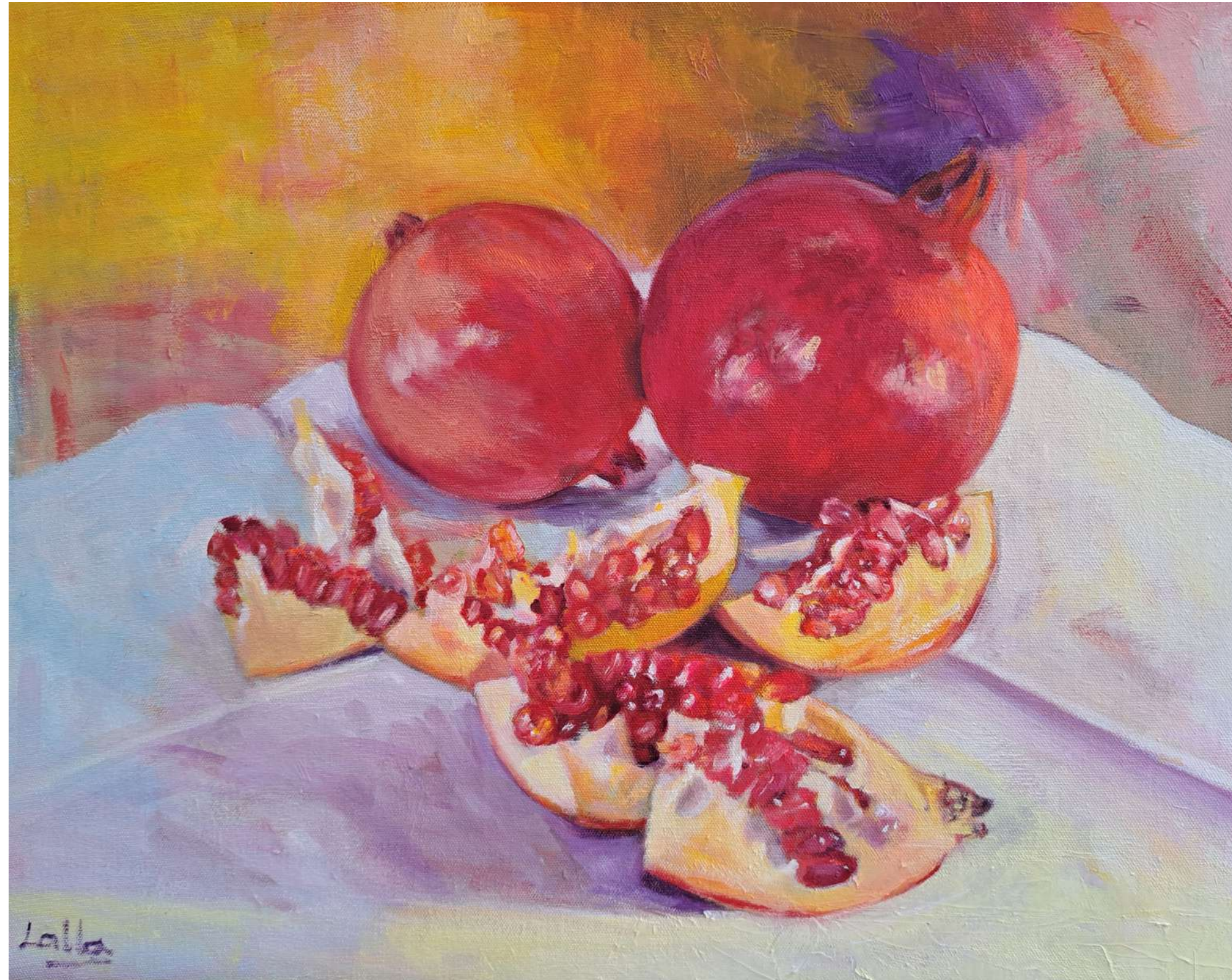
GRANADAS ACRÍLICO SOBRE TABLA 34 x 40 cm