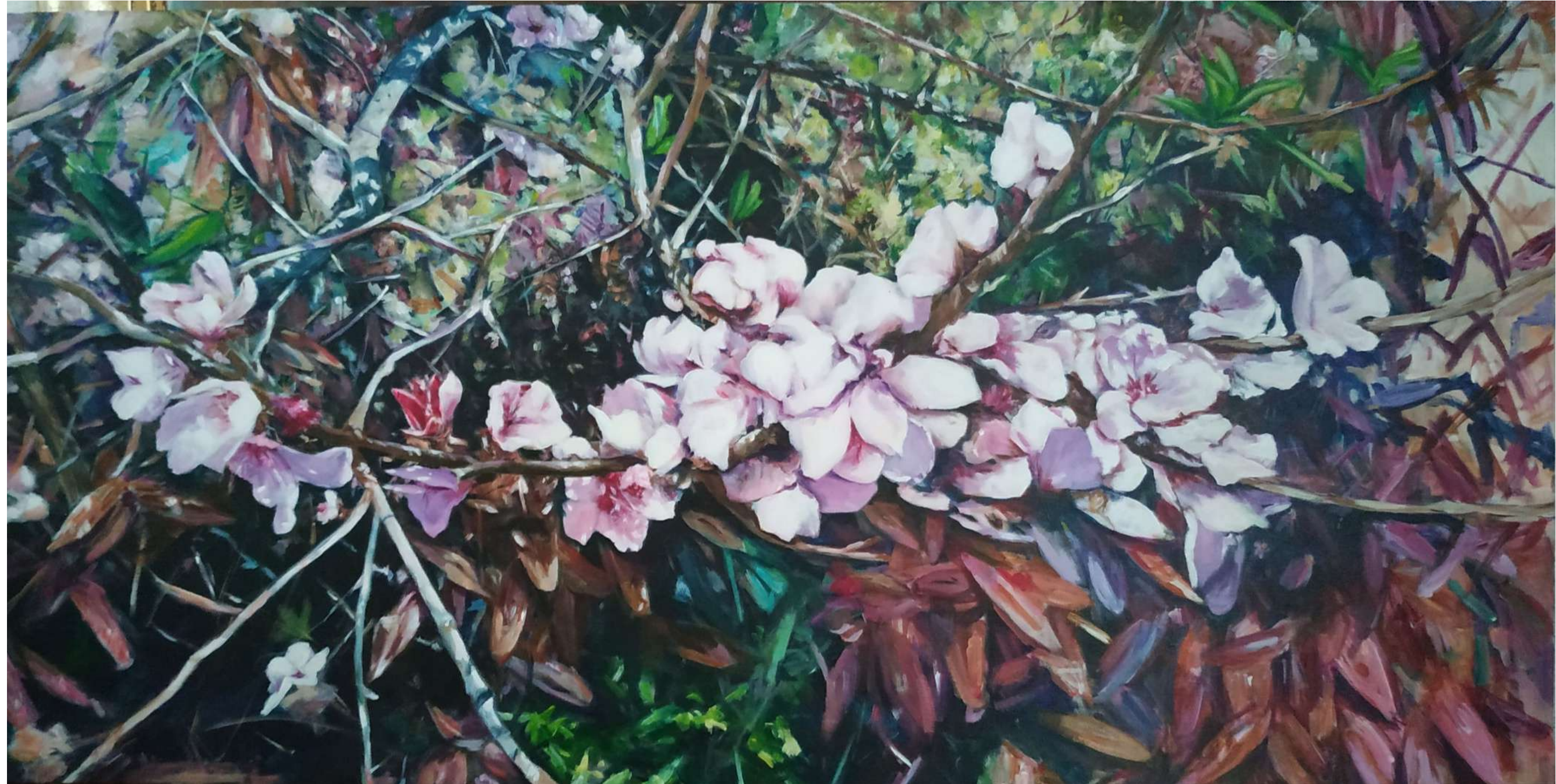
¿RAMAS SECAS? ACRÍLICO SOBRE LIENZO 50 x 100 cm