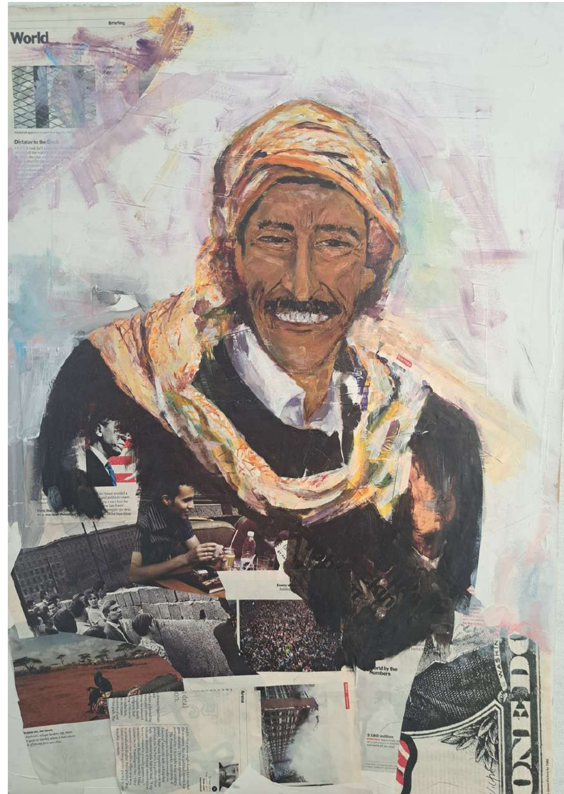
EL BEDUINO COLLAGE, ACRÍLICO SOBRE TABLA 50 x 70 cm