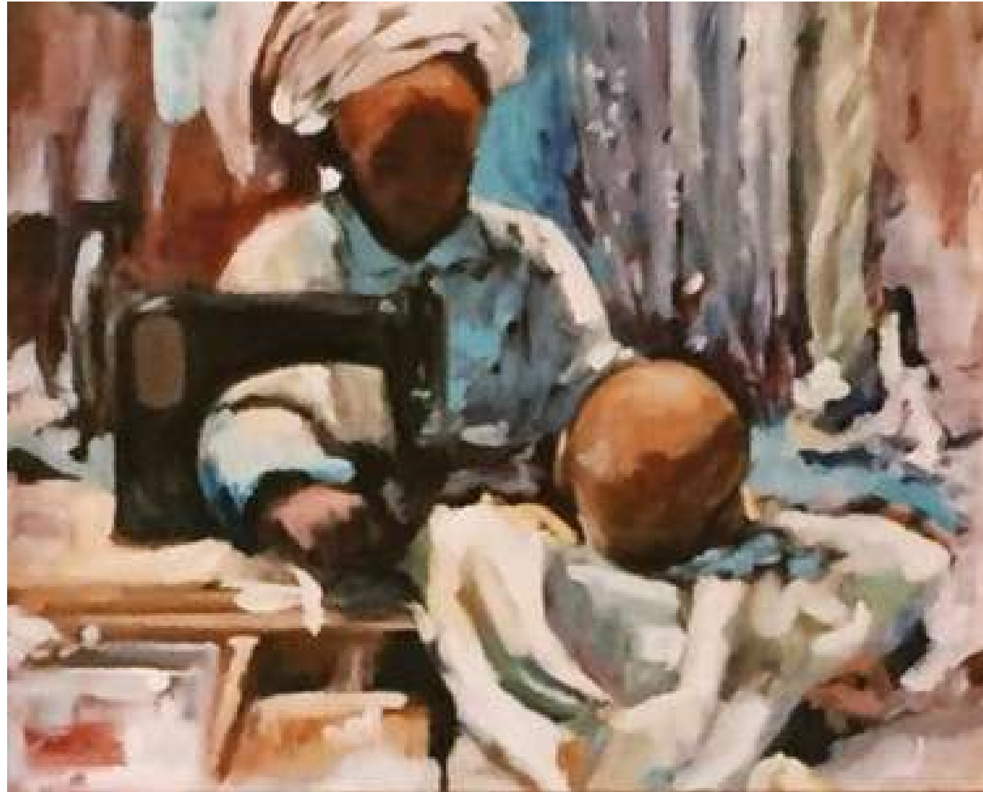
EL ARTESANO ÓLEO SOBRE LIENZO 40 x 30 cm