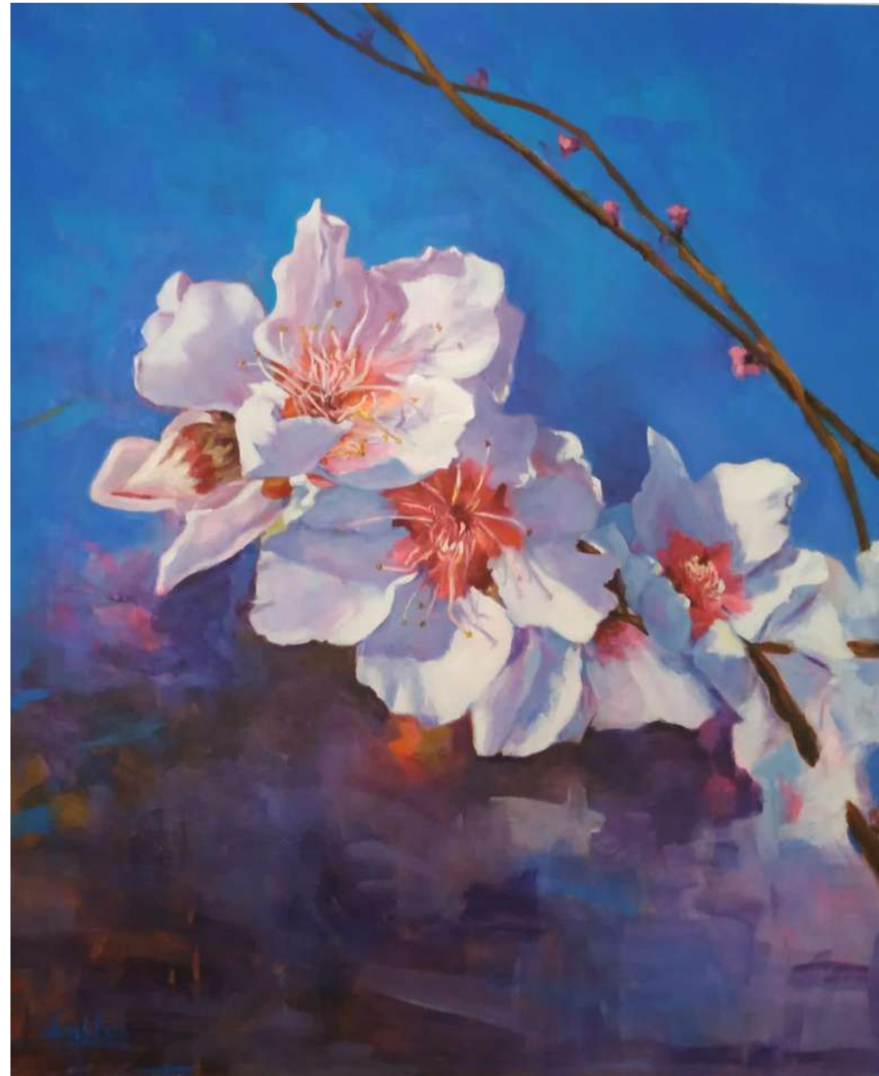
FLOR DE MELOCOTONERO ACRÍLICO SOBRE LIENZO 50 x 60 cm