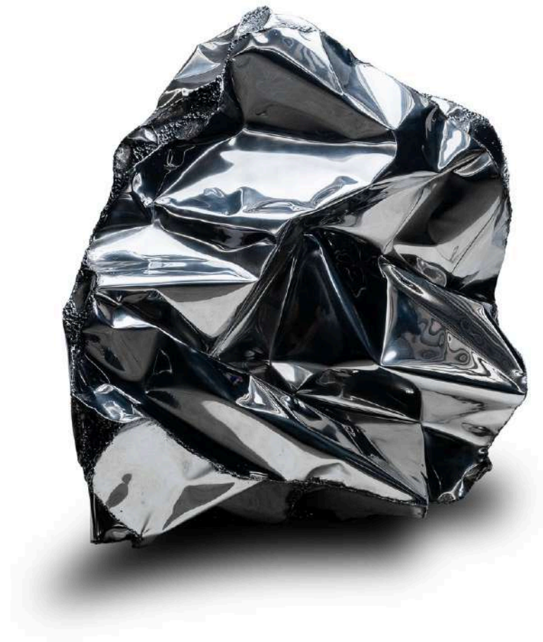
MINERALIDAD (PIEDRA1) Escultura | acero inoxidable 118 x 84 x 79 cm