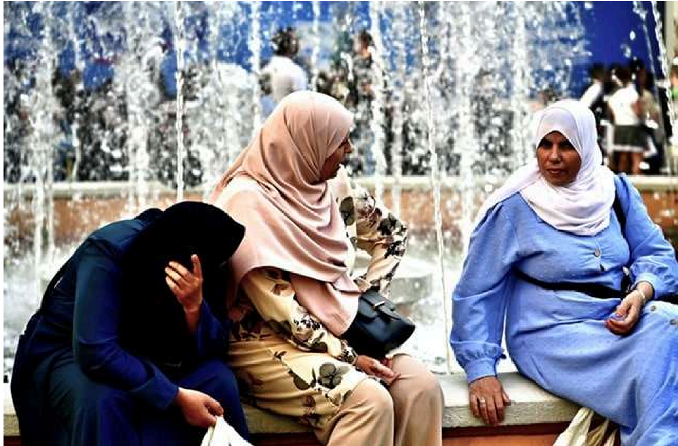
TRES MUJERES ÁRABES Ed. Digital Personalizada 65 x 42 cm.