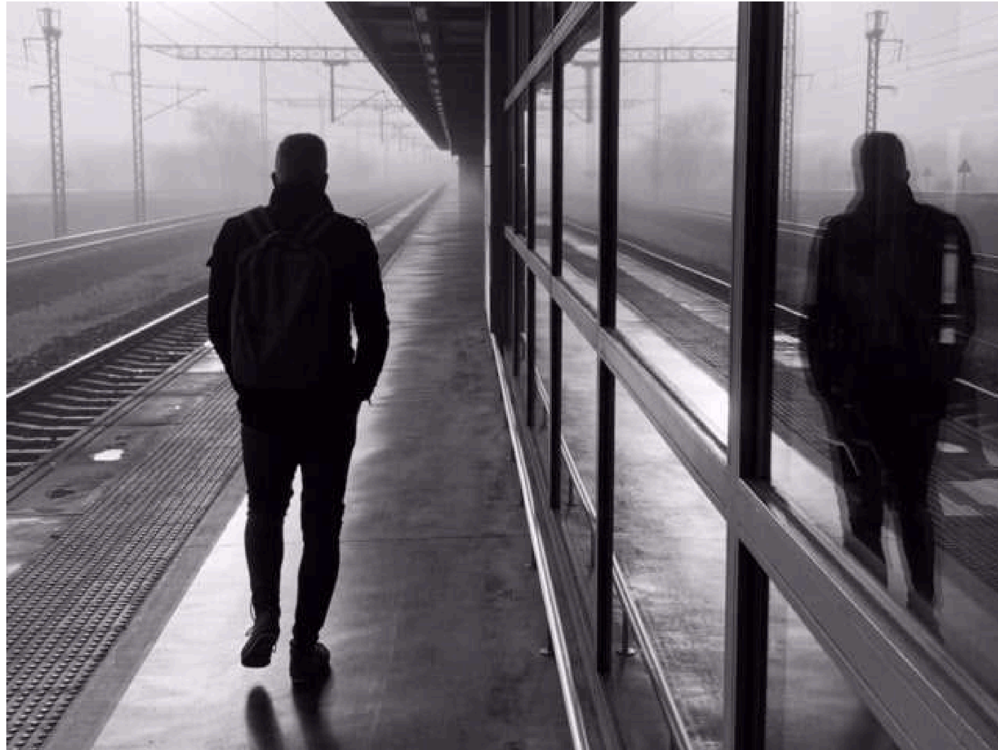
REFLEJOS EN LA ESTACIÓN DE ALBACETE Ed. Digital Personalizada Tratamiento B/N 55 x 41 cm.