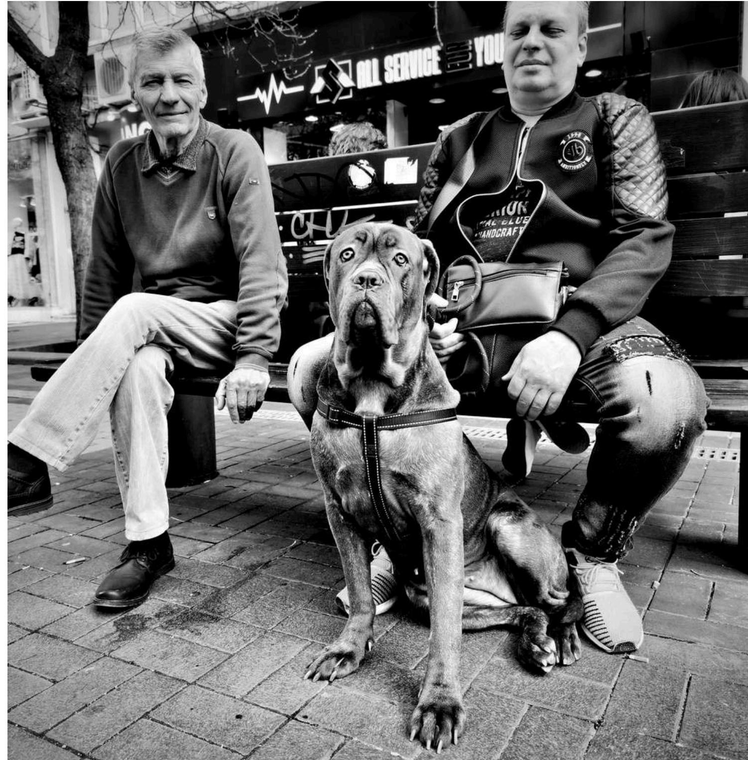
PERRO VIEJO (SOFÍA, BULGARIA. 2023) Ed. Digital Personalizada Tratamiento B/N 65 x 59 cm.