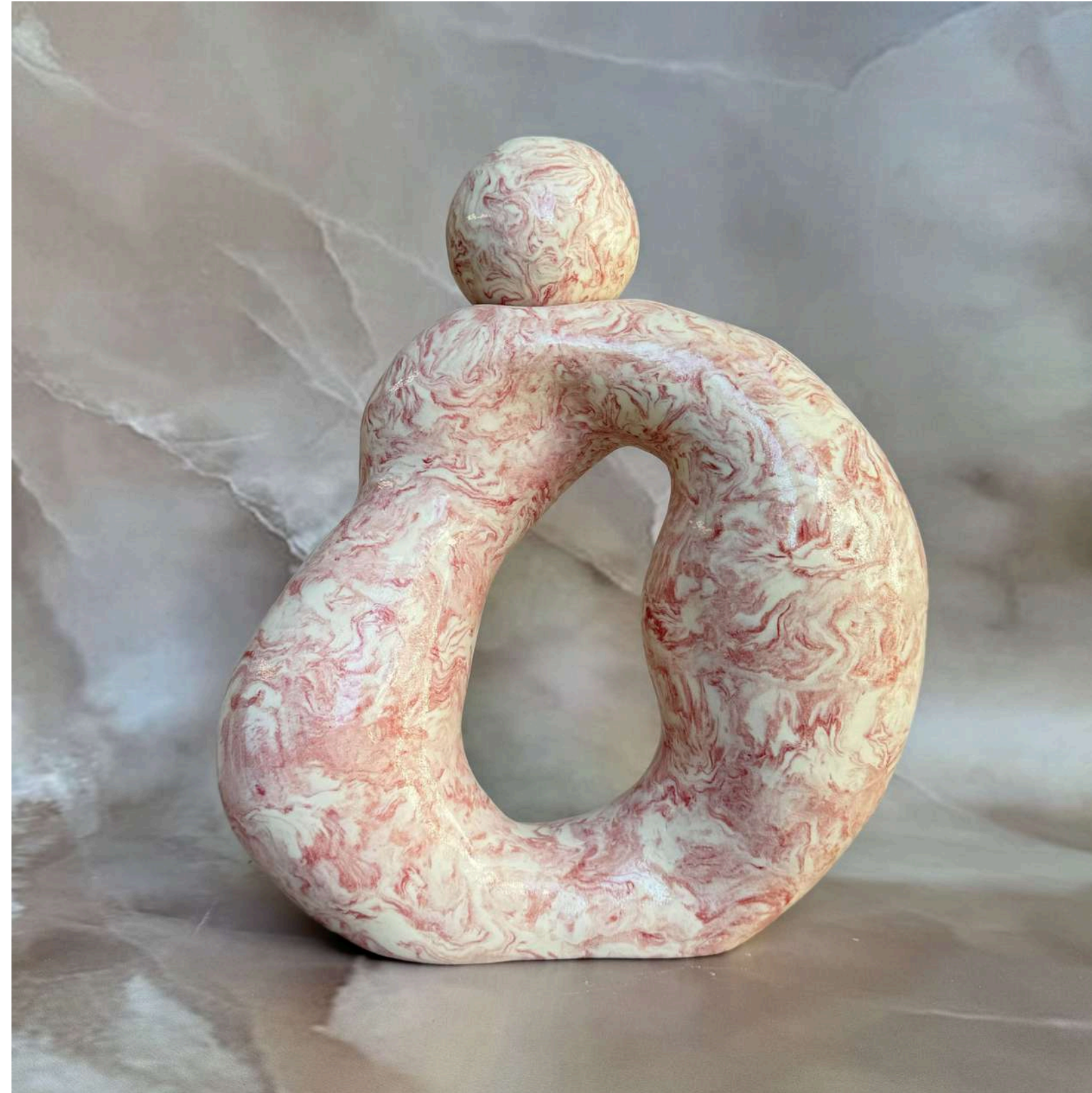
SCARLET SWIRL Manually modeled 35 cm (H)