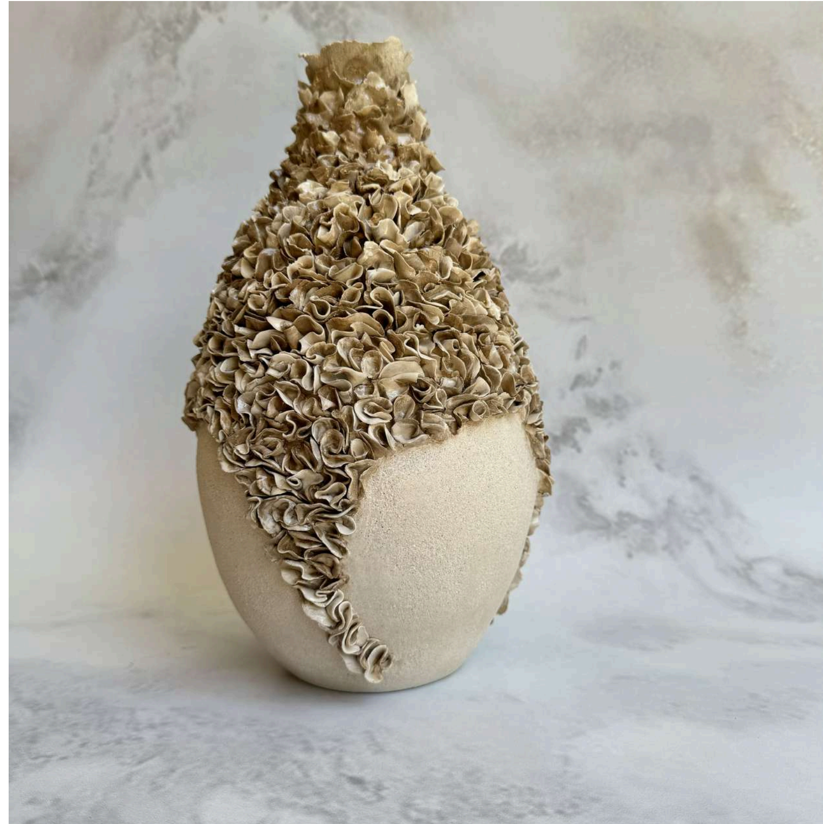
CORAL WHISPERS Manually modeled 28 cm (H)