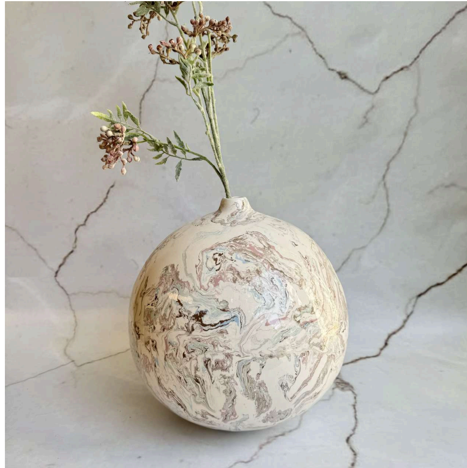
LUNAR WHIRL Manually modeled 30 cm (H)