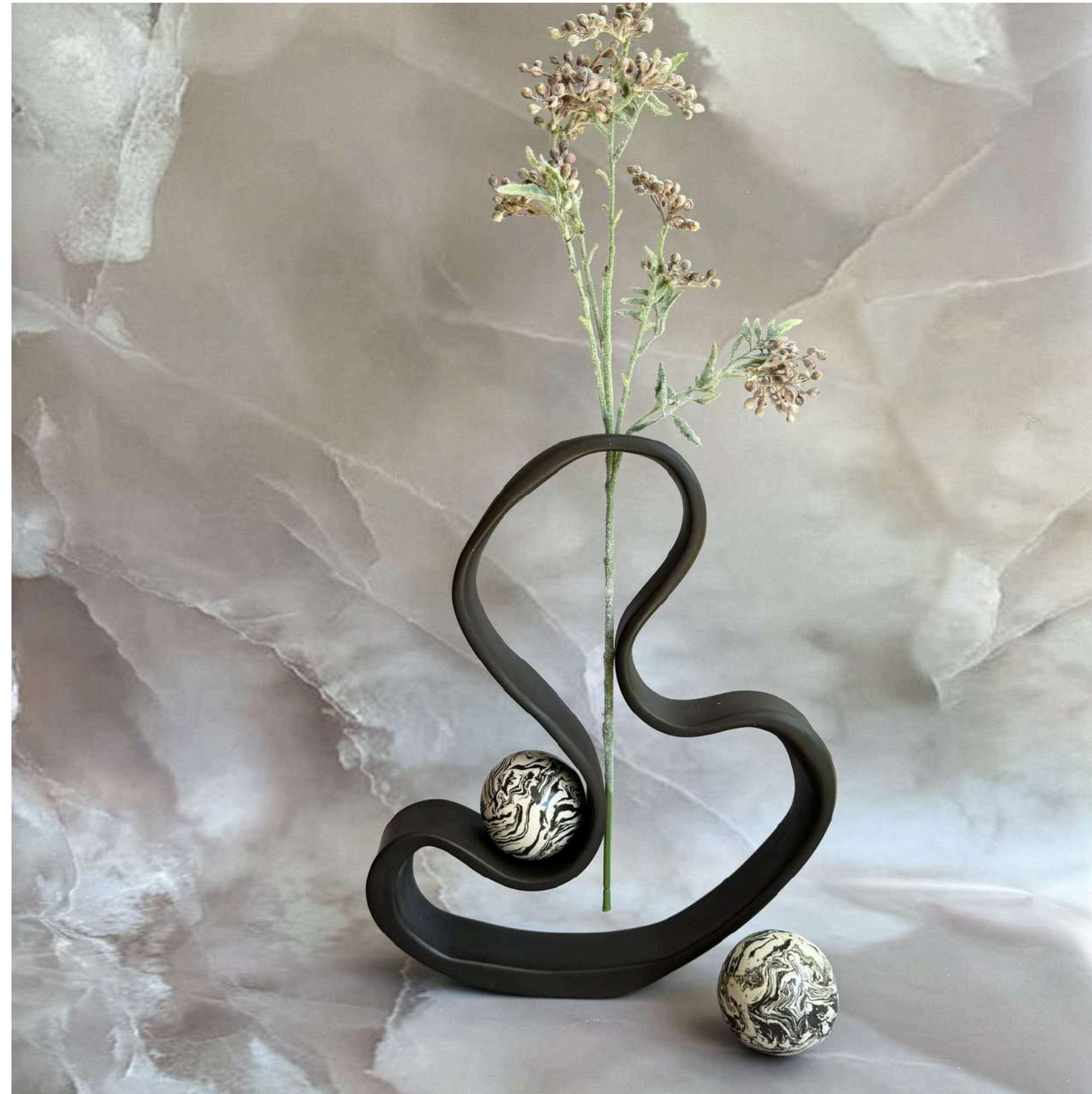
MOLTEN MAJESTY Manually modeled 40 cm (H)