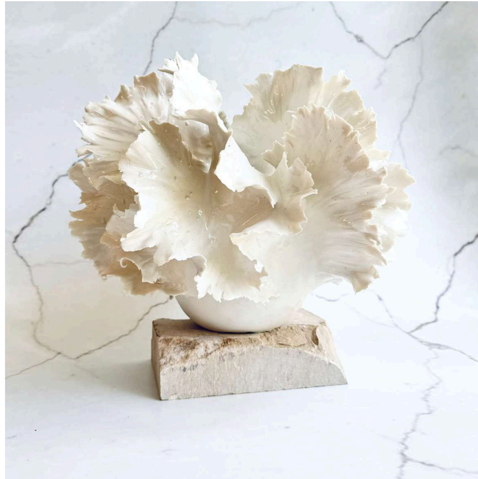
WHITE CORAL Manually modeled 26 cm (H)