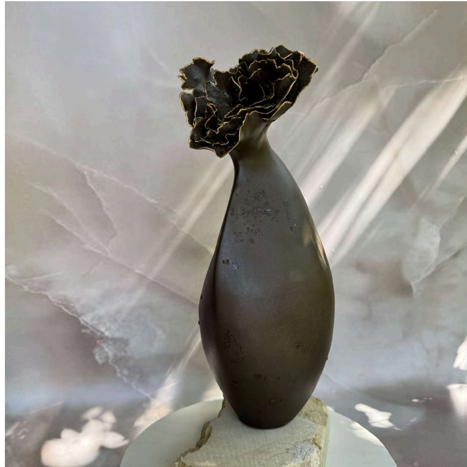
GILDED BLOOM Manually modeled 38 cm (H)