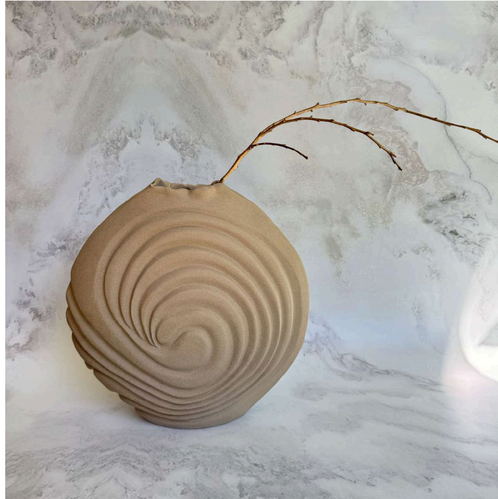
SPIRAL SERENITY Manually modeled 40 cm (H)