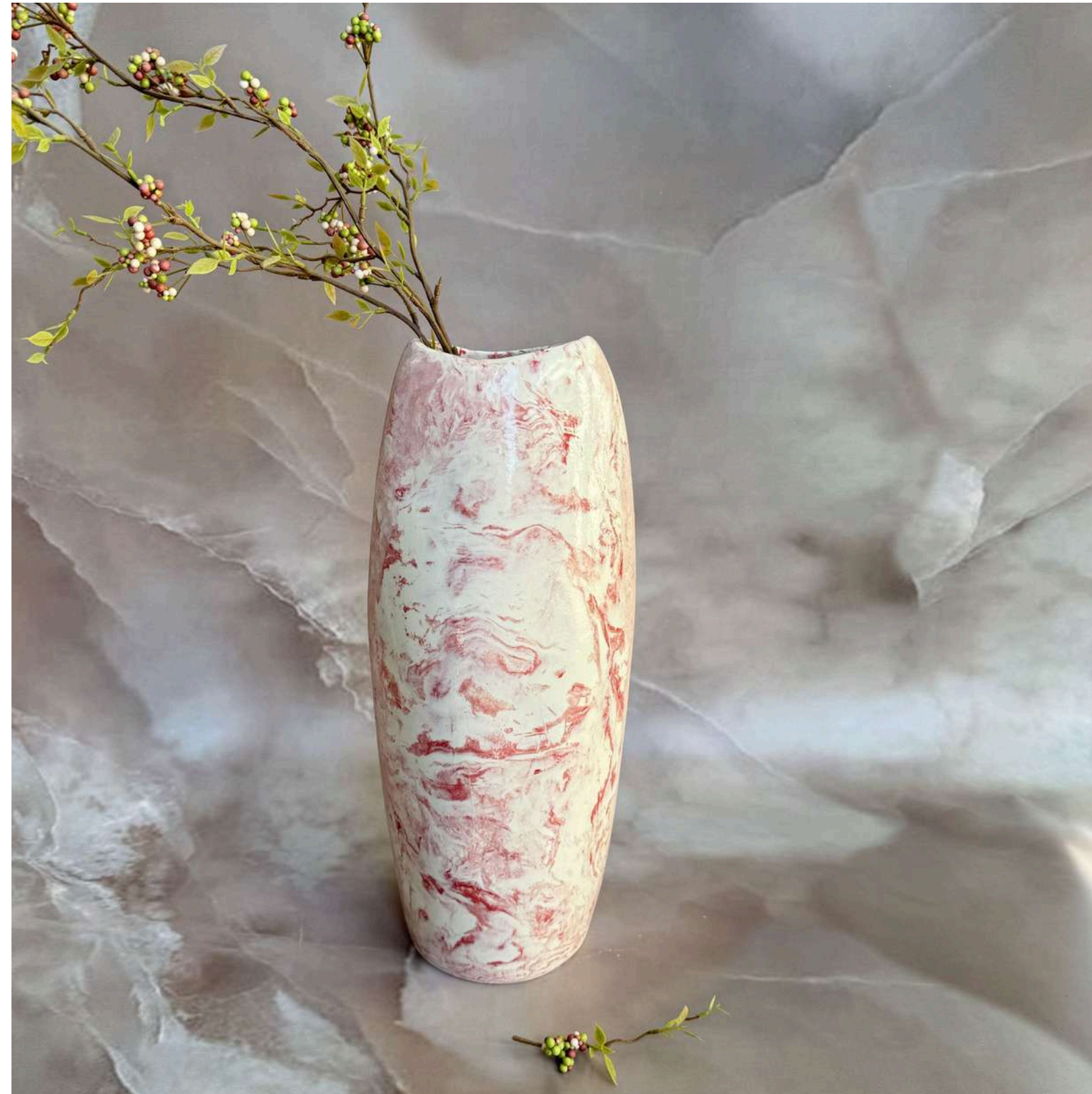
CRIMSON VEIL Manually modeled 42 cm (H)