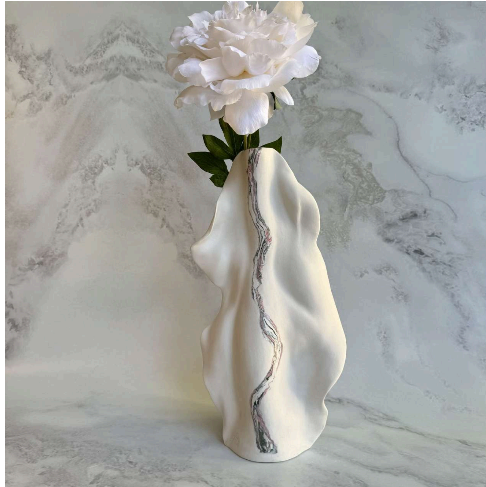
OCEAN'S MUSE Manually modeled 40 cm (H)