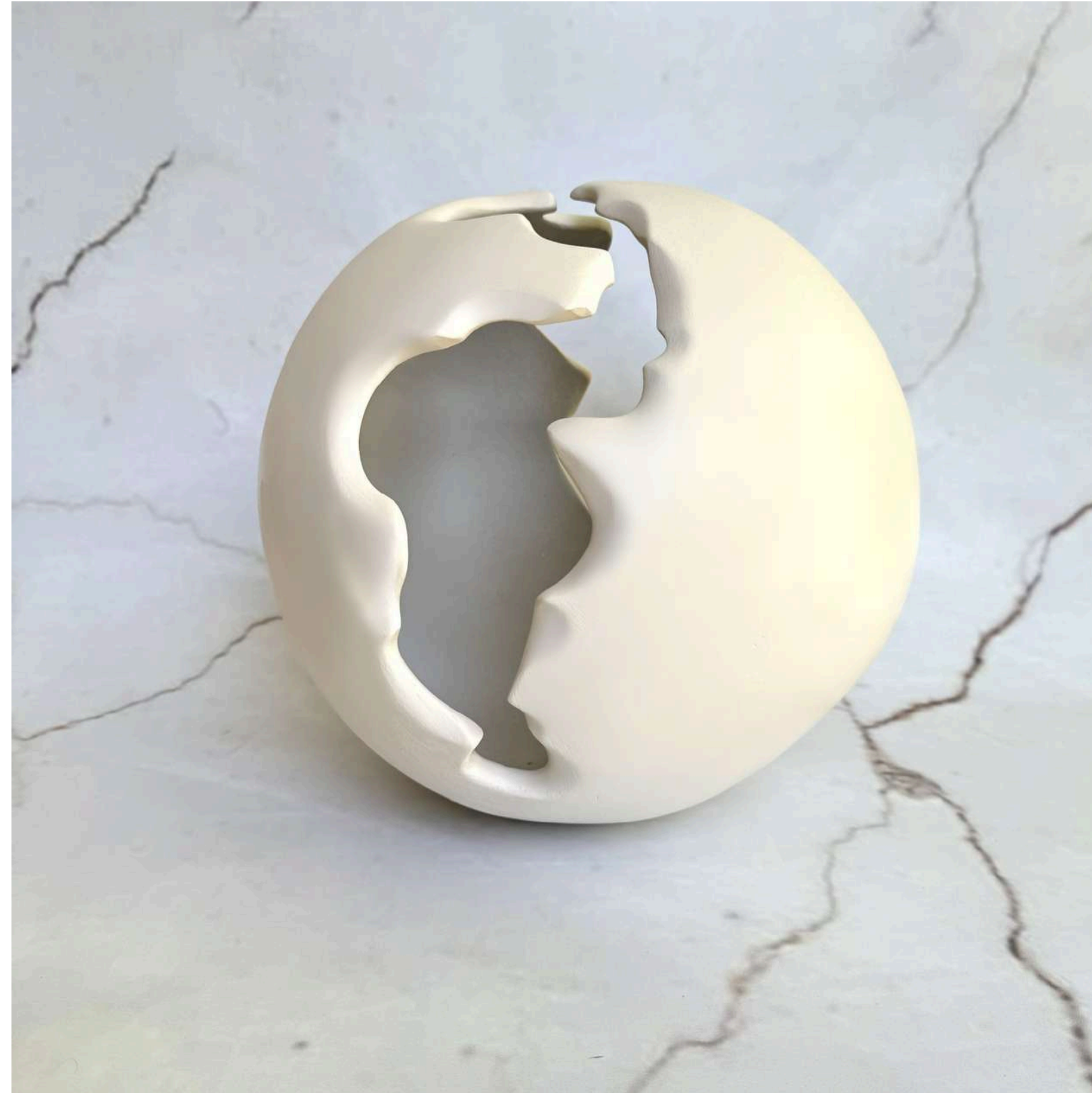
CRACKED SPHERE Manually modeled 30 cm (H)